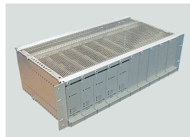
19 inch 3HE rack