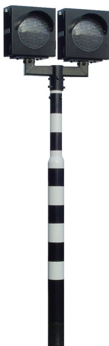
2- aspect LVS

Op de unit kunnen maximaal 24 NMA LED modules worden aangesloten (met een diameter van 200 of 300 mm). Elk met een opgenomen vermogen van circa 10 Watt. De toe te passen LED modules zijn standaard voorzien van een overspanningbeveiliging.